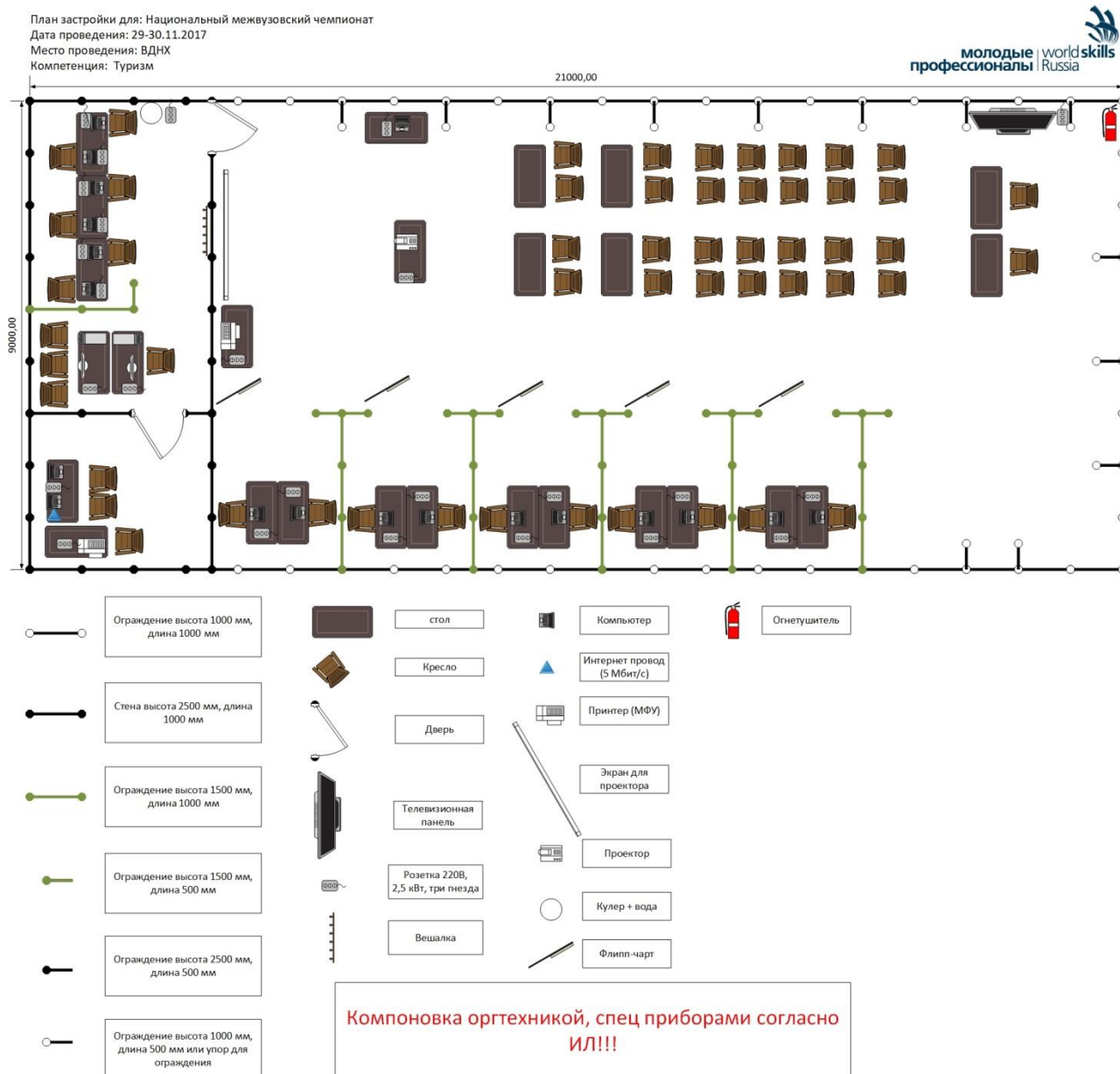
Схема конкурсной площадки